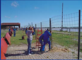
INGENIERÍA Y REHABILITACIÓN