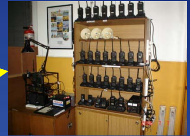
ALARMA Y COMUNICACIÓN